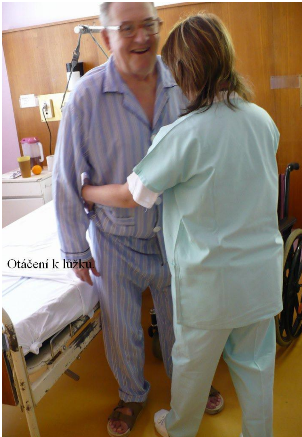
Otáčení k lůžku.